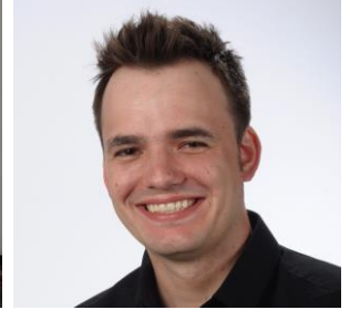
Innovation & Transforma- tion Designer, Scrum Master (scrum.org), Trai- ner, Coach und Berater

Lehrinstitut der European Coaching Association